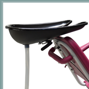
Bac à shampooing réglable et amovible.