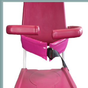
Jeu de 2 protections étanches pour ceinture de maintien.