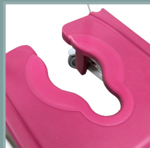
Bouchon d'assise adaptatif.