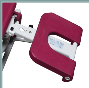
Option repose-jambes réglable.