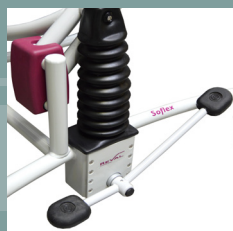
Pédale de levage hydraulique