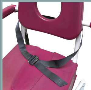
Ceinture de maintien abdominale.