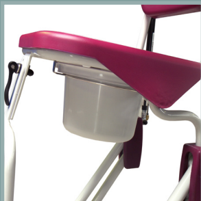
Seau avec rails de guidage.