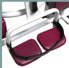
Appui-pieds de série