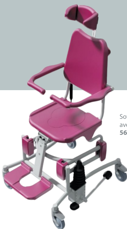
Soflex hydraulique 5606.00 avec option repose-jambes 5600.50

Transfert des patients, accès aux toilettes ou à la douche, soins corporels, en toute sécurité grâce à un équipement polyvalent et confortable.