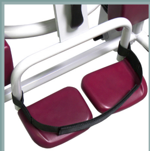
Sangles de maintien des pieds du patient.