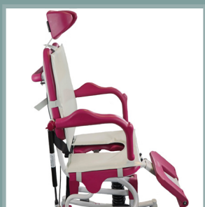
Ensemble coussin d'assise + dossier.