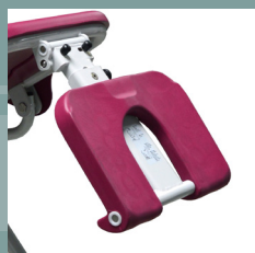
Option repose-jambes 5600.50