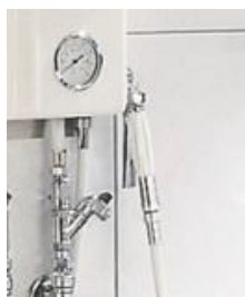
Douchette pour l'eau