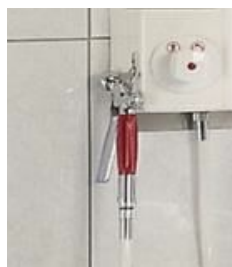
Douchette de désinfection