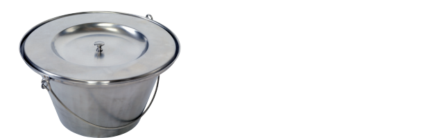
Seau hygiénique en acier inoxydable avec couvercle