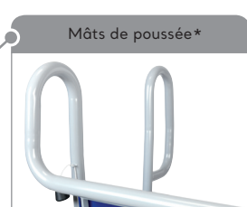
Mâts de poussée*

* Non disponible sur la version de base ** Accessoires