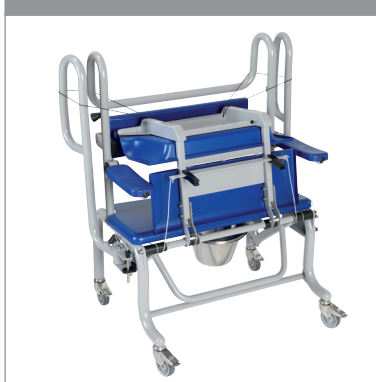
Compact pour le rangement/transport*