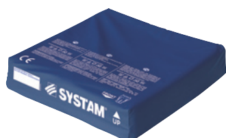
VERSION POLYMAILLE® HD