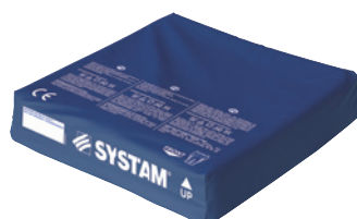
VERSION POLYMAILLE® HD