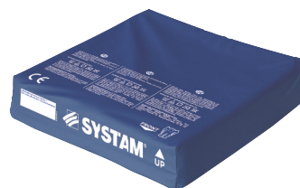
HOUSSE POLYMAILLE® HD

REF se terminant par 1HF : coussin livré avec 1 housse