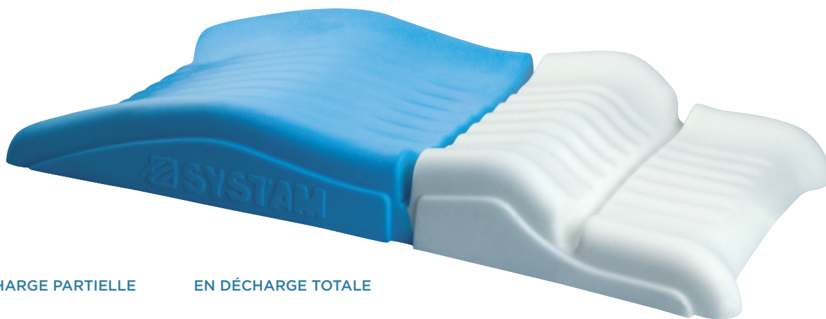
EN DÉCHARGE PARTIELLE