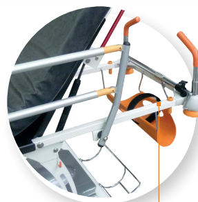
Porte obus O 2 (option)