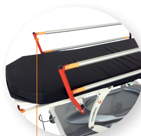
Montants de barrières colorés (option)