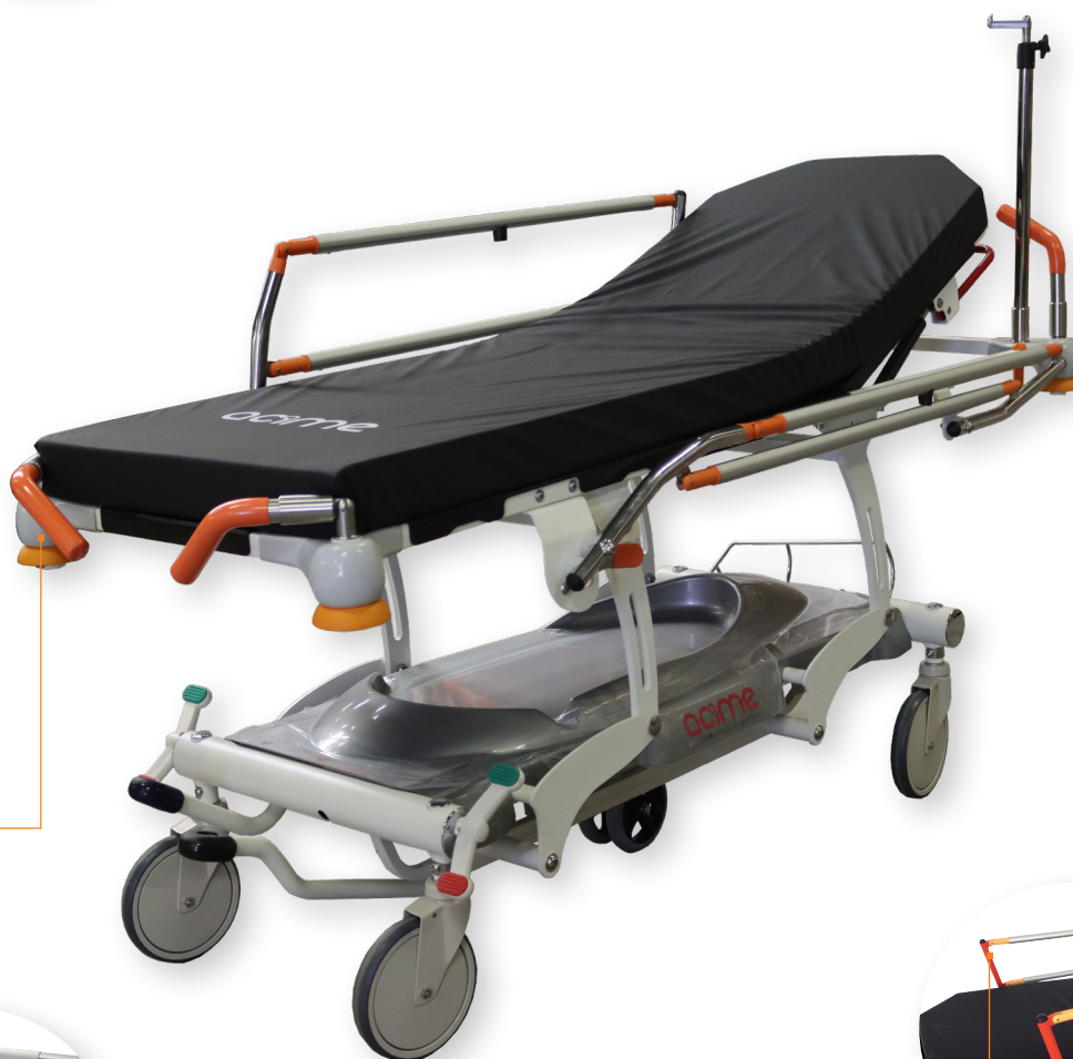
Poignées escamotables (option)