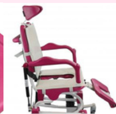
Coussins de confort