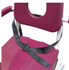
Ceinture de maintien ventral