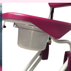
Seau & rail de guidage