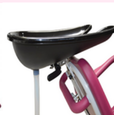
Bac à Shampoing adaptatif