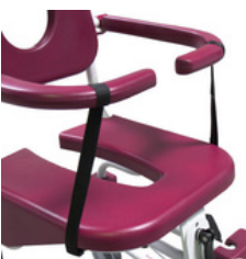
Sangles de sécurité