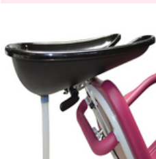
Bac à Shampooing adaptatif