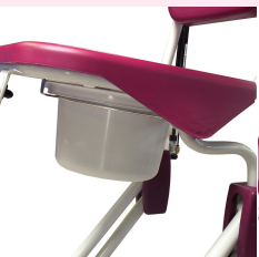
Seau & rail de guidage