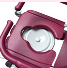
Bouchon d'assise adaptatif

Les soins d'hygiène quotidiens sont pour un grand nombre de personnes faits de façon autonome et synonyme d'intimité.