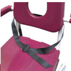
Ceinture de maintien ventral