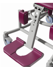
Appui-pied avec palettes