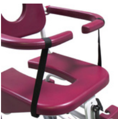
Sangles de sécurité