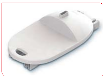
Poignée intégrée et butées sécurisées permettant un transport facile.

Facile d'utilisation, non seulement parce que la toise se démonte en un tour de main, mais aussi grâce à la poignée qui rend le stadiomètre très maniable et permet de l'emporter partout avec soi.