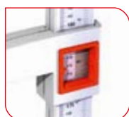
Deux grandes fenêtres latérales facilitent la lecture des graduations.