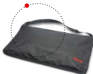
Sacoche seca 412 pour le transport.