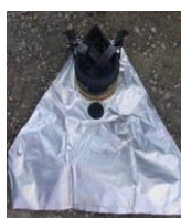
UM120007 UM120009 UM120012