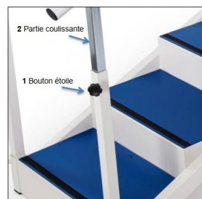
Système pour régler la hauteur des mains courantes