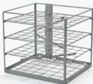
Rack instruments 4 niveaux

Doté d'une grande variété d'éléments complémentaires, le laveur MAT LD100 fournit des solutions pour tous les types de dispositifs et capacités, y compris les supports pour instruments, microchirurgie, anesthésie ou équipement de laboratoire.