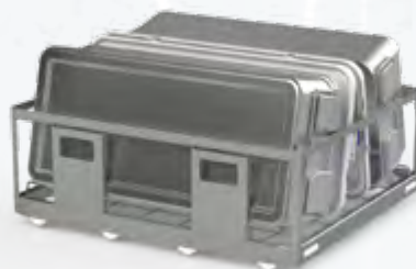
Rack 2 conteneurs DIN 600 x 300 x 150 mm