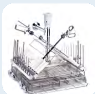
Rack instruments MIC