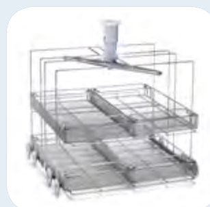
Rack 2 niveaux