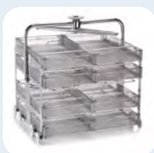
Rack 4 niveaux