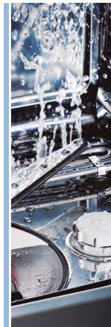
Laveur Désinfecteur Matachana MAT LD60