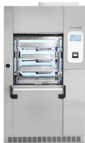
Laveur 8668 Turbo Produit Configuration A7