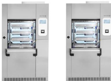
Laveurs série 86 Produits Configuration A5 et A6