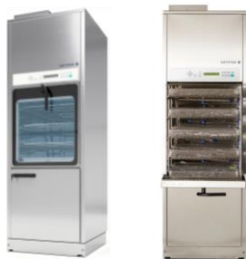
Laveurs série 46 Produits Configuration A1 à A4