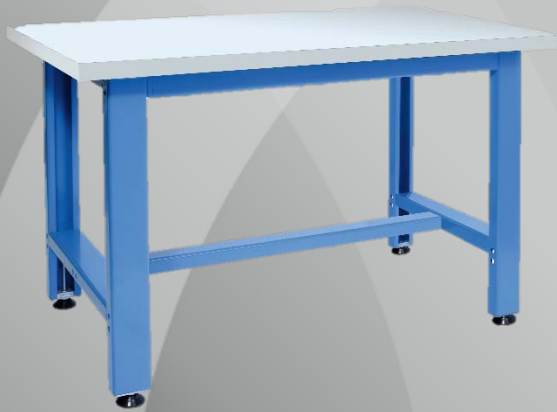
Visuels non contractuels