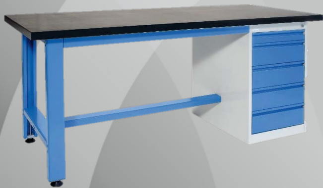
Visuels non contractuels