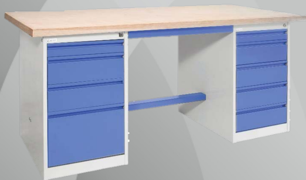
Visuels non contractuels