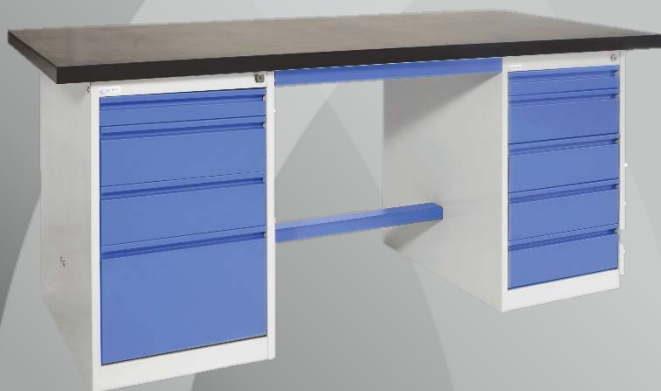
Visuels non contractuels