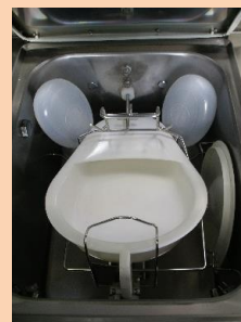
1 bassin et 2 urinaux