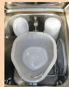
1 seau de chaise et 2 urinaux/bocaux