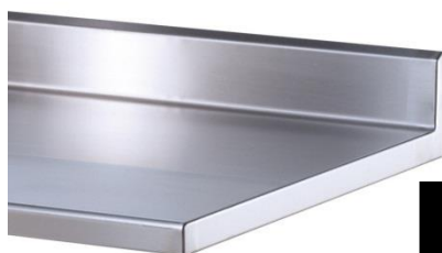
DESSUS A DOSSERET