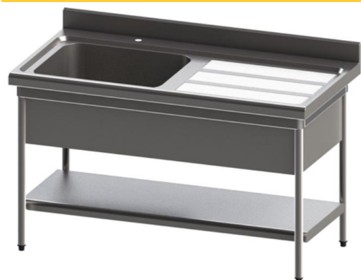
PA112D + EGA