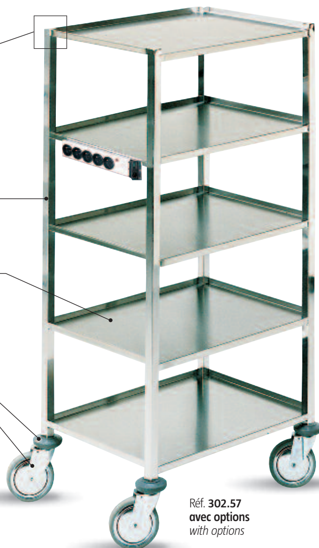
Réf. 302.57 avec options with options

Construction entièrement soudée sous argon. Qualité inox 18/10 (AISI 304). Extrémité du piétement obturée, soudée, étanche.