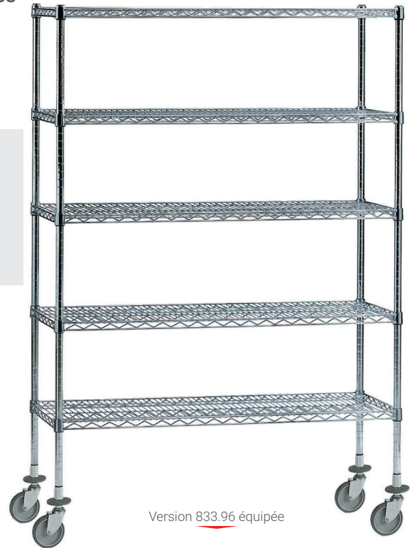
Version 833.96 équipée

CHARGES MAXIMUM : par rayonnage : 300 kg par étagère fil : 200 kg