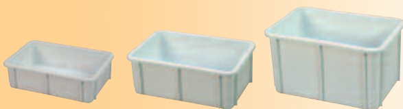
H 165 mm