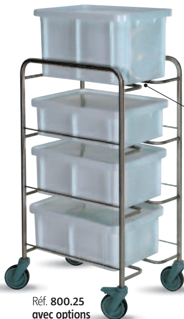
Réf. 800.25 avec options with options

Trolleys designed for decontamination containers 600 x 400 mm and 530 x 325 mm. High finishing, without unevenness for users security. Tube extremities completely watertight by welding (no plastic tips).