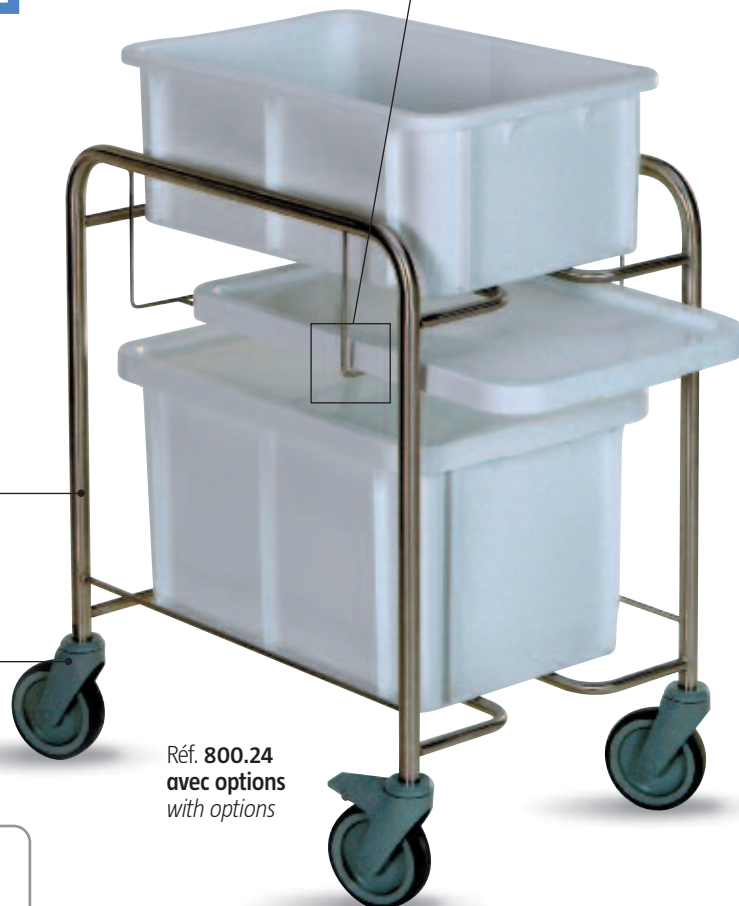
Réf. 800.24 avec options with options