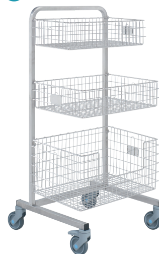
Version 830.80 équipée