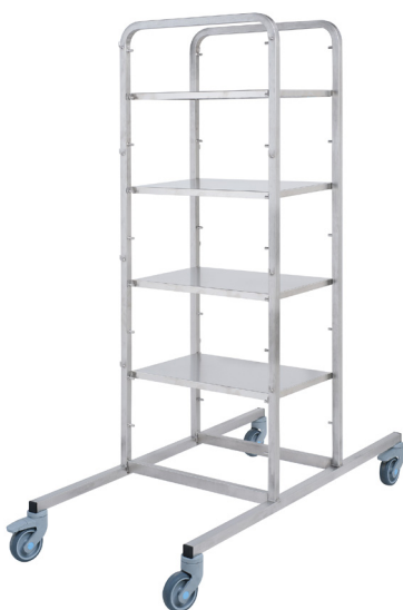
Version 830.79 équipée