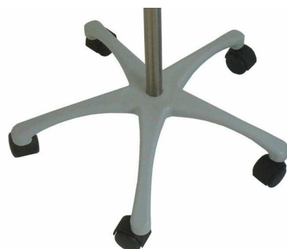
G – Gris