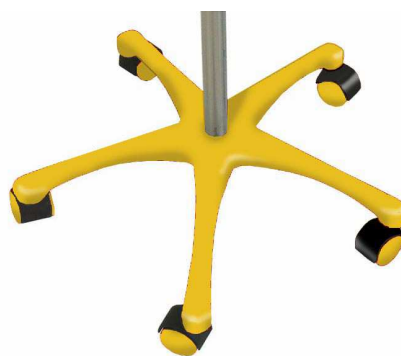
J – Jaune