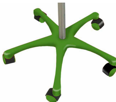
V – Vert