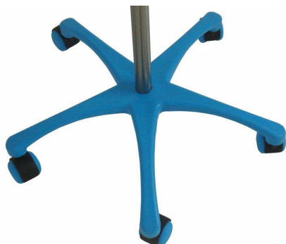
B – Bleu

Embase noire aucune lettre (exemple : 4 crochets inox en U, Réf. 17734U)