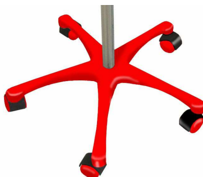
R – Rouge