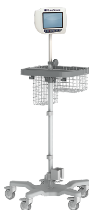
Moniteur vidéo GlideScope