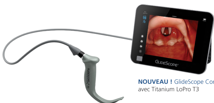
NOUVEAU ! GlideScope Core avec Titanium LoPro T3