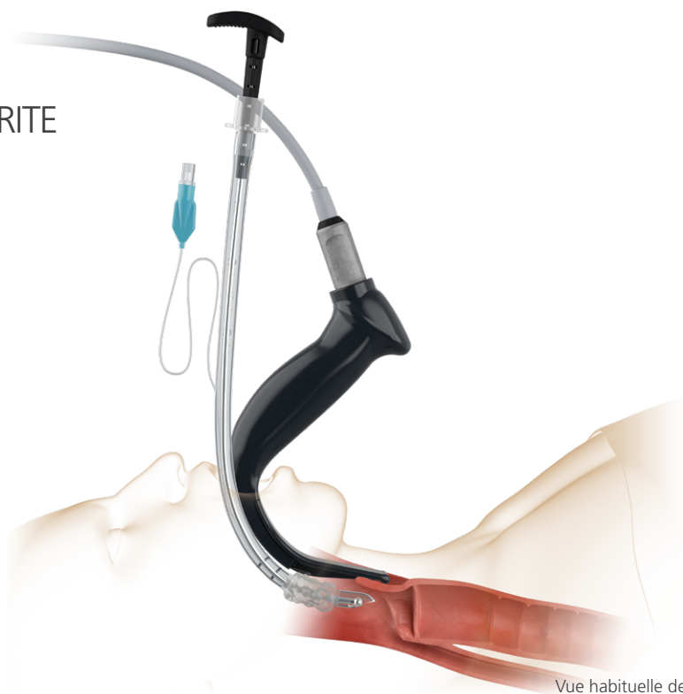
Vue habituelle des voies aériennes