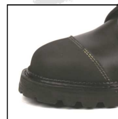
Pare Pierre Caoutchouc