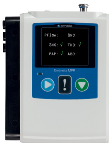
MPR PG Embletta