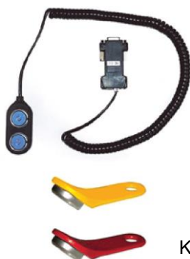
Kit de transfert usb + clefs