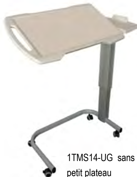
1TMS14-UG sans galerie sur le petit plateau