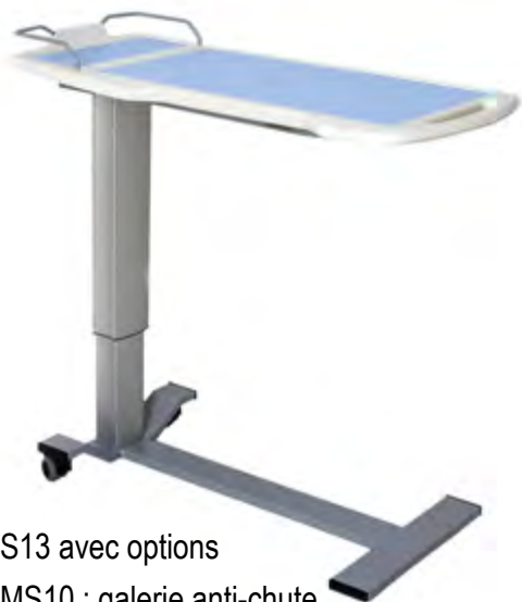
1TMS13 avec options - OTMS10 : galerie anti-chute - OTMS14-2 : piètement extra plat