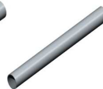
Manchon de Jonction