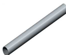
Manchon de base