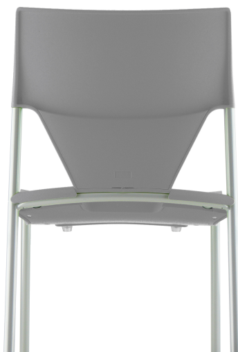
Gris clair RAL 7004 Light grey RAL 7004