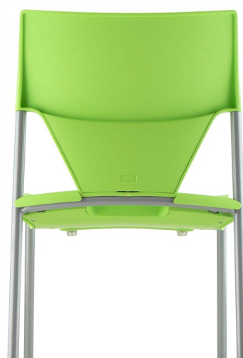
Vert anis Pantone 373 Green anise Pantone 373