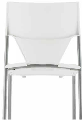
Blanc pur RAL 9010 Pure white RAL 9010