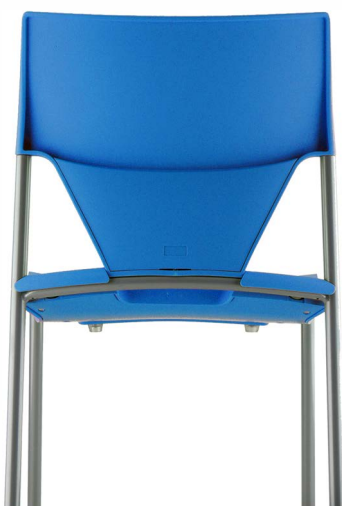
Bleu Azur Pantone 299U Blue Pantone 299U