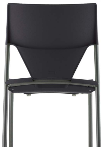
Gris anthracite RAL 7021 Dark grey RAL 7021