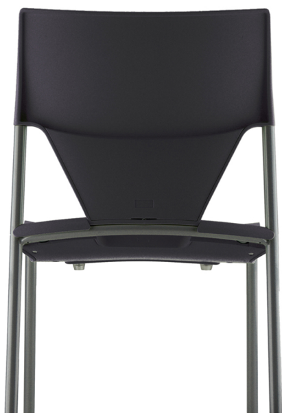
Gris anthracite RAL 7021 Dark grey RAL 7021