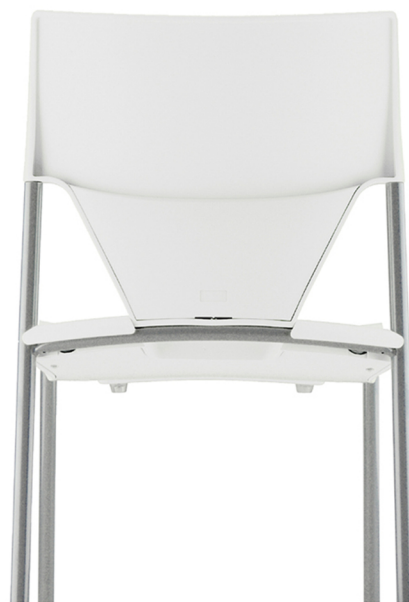
Blanc pur RAL 9010 Pure white RAL 9010