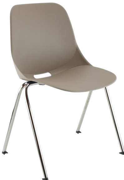
Taupe Pantone 404C Taupe Pantone 404C