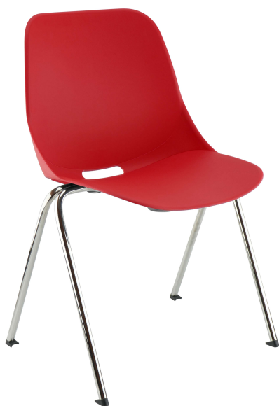
Rouge RAL 3020 Red RAL 3020