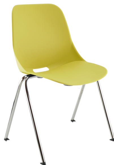
Vert Pantone 457C Green Pantone