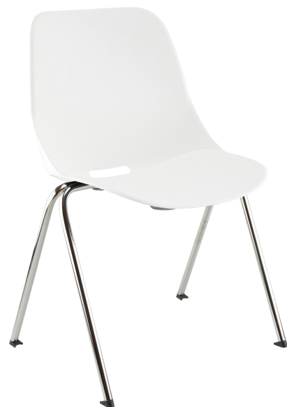
Blanc RAL 9003 White RAL 9010