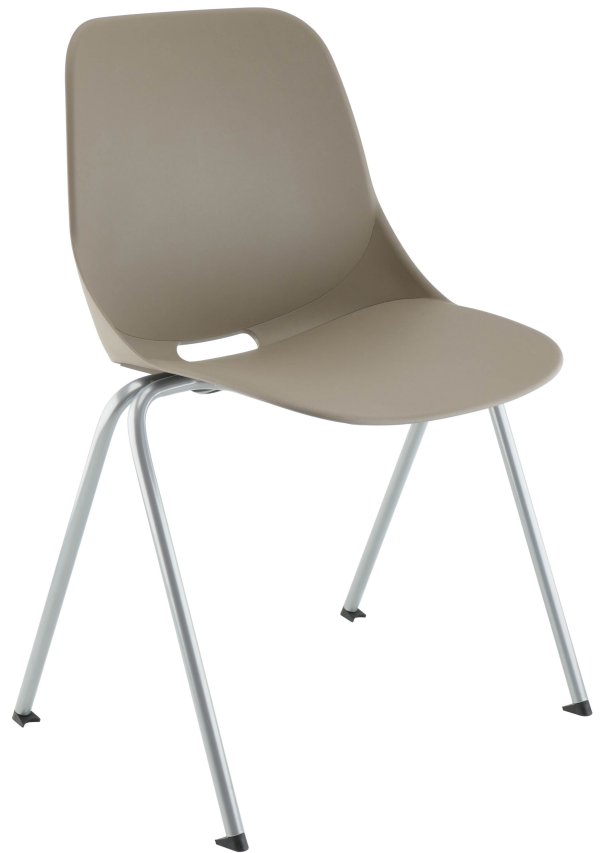
Taupe Pantone 404C Taupe Pantone 404C