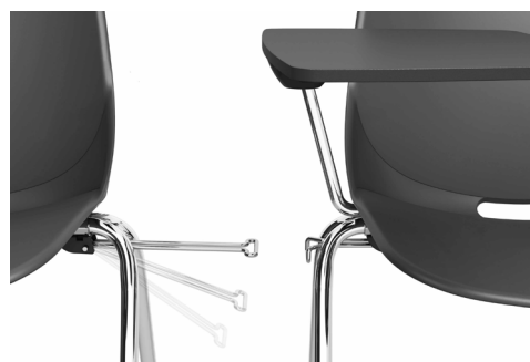
Schéma générique :