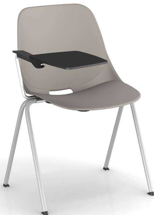
Taupe Pantone 404C Taupe Pantone 404C