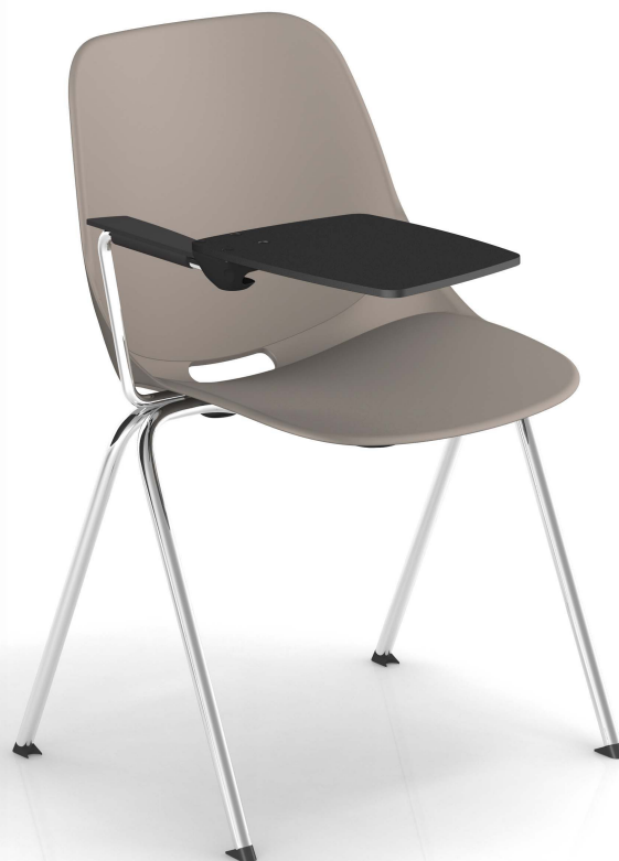
Taupe Pantone 404C Taupe Pantone 404C