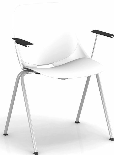
Blanc RAL 9003 White RAL 9010