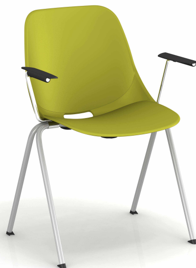
Vert Pantone 457C Green Pantone