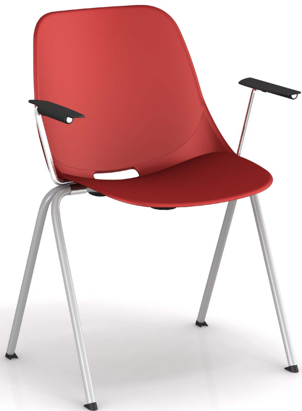
Schéma générique :