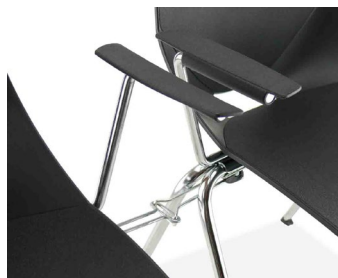
Système d'accroches rabattables optionnel.