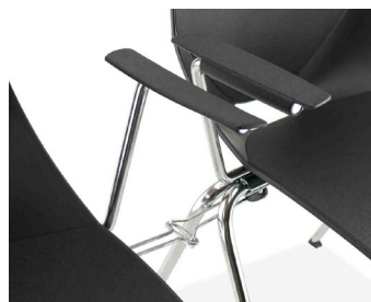
Système d'accroches rabattables optionnel.