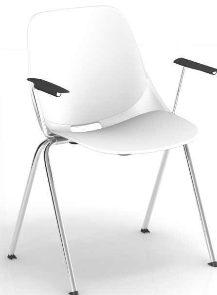
Blanc RAL 9003 White RAL 9010