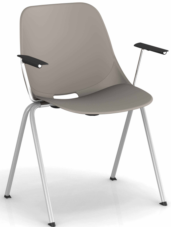
Taupe Pantone 404C Taupe Pantone 404C