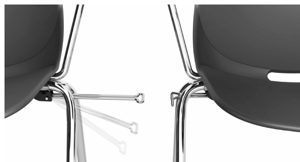
Schéma générique :