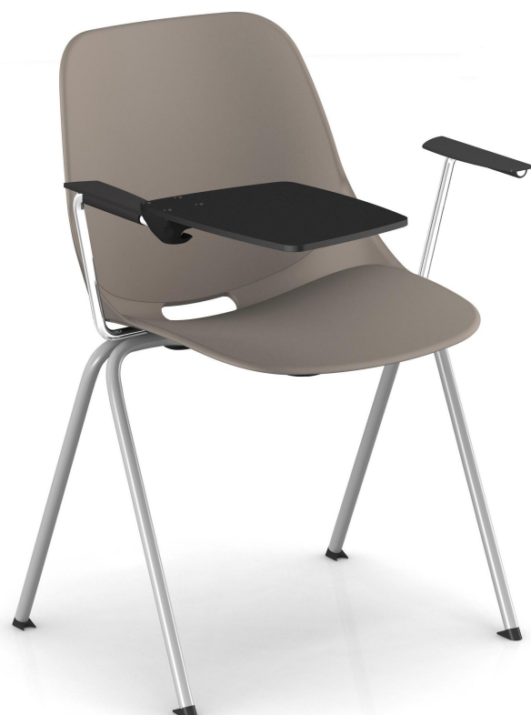
Taupe Pantone 404C Taupe Pantone 404C