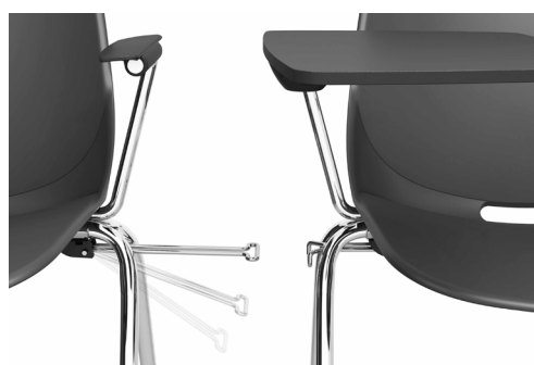
Schéma générique :

2 coloris de coque : Noir (/2N), Taupe Pantone 404C (/2_).