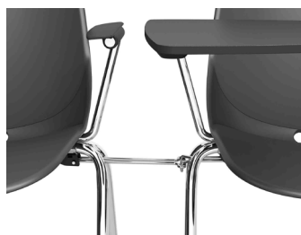
Système d'accroches rabattables