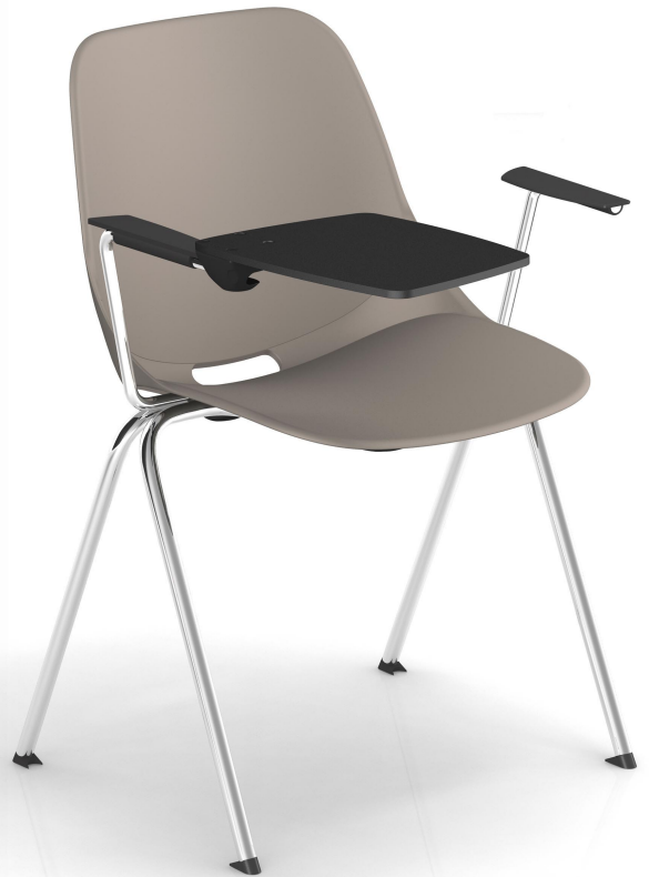
Taupe Pantone 404C Taupe Pantone 404C