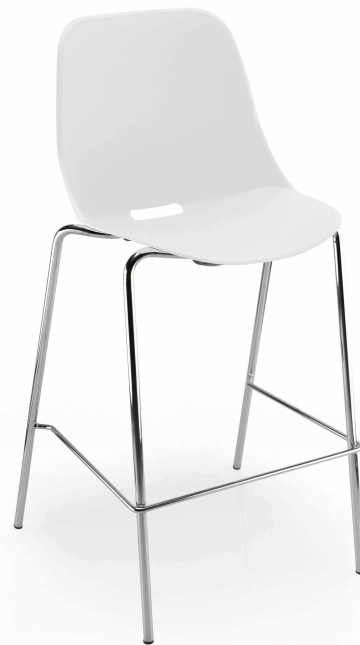
Blanc RAL 9003 White RAL 9010