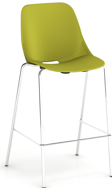
Vert Pantone 457C Green Pantone