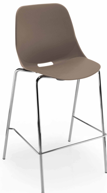
Taupe Pantone 404C Taupe Pantone 404C