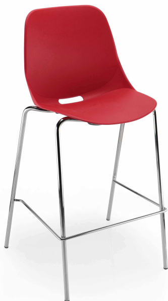
Rouge RAL 3020 Red RAL 3020