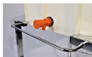
Protection de robinet de vidange

Toute notre gamme de chariot est réalisée en inox 304L avec une finition polissage électrolytique afin de garantir le lavage optimal de la surface, entièrement soudée sous argon, toutes les extrémités de tubes sont bouchonnées soudées, tous les inserts de roues sont en inox soudé au tube intérieur afin de garantir une extrême résistance aux chocs.