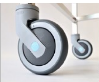
Equipé de 4 roulettes (dont 2 à frein) avec roulement à bille inox.