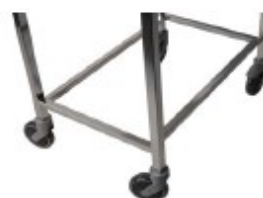
Piètement tube de 30x30mm