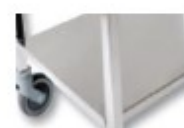
Plateau bas en option Référence: N.02 211/1T