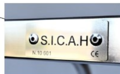
Plaque d'identification SICAH avec référence et marquage CE