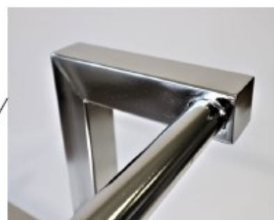
Poignée de guidage Soudure Argon