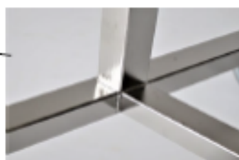
Soudure de nos tubes sous argon