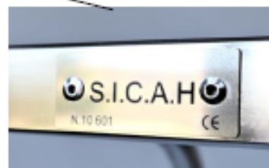
Plaque d'identification SICAH avec référence et marquage CE