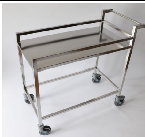
Chariot N.02 211/09