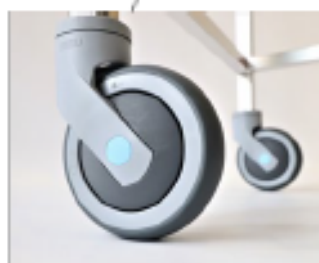
Equipé de 4 roulettes (dont 2 à frein) avec roulement à bille inox.