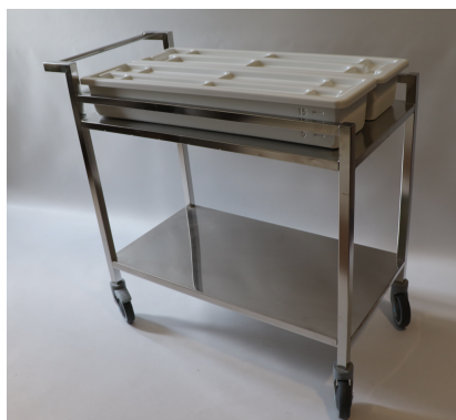
Chariot N.02 211/09 avec l'option étagère basse N.02 211/09TABI et 2 ensemble autoclavable N.02 695/A