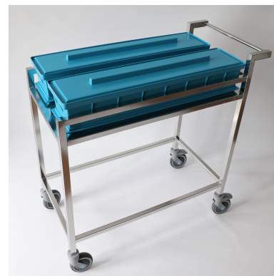
Chariot N.02 211/09 et 2 ensemble non autoclavable N.02 695