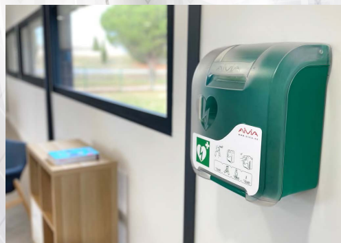
Gamme de boîtiers pour l'intérieur ou l'extérieur